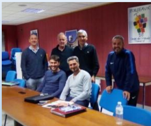
Réunion sous-commission Football Educatif